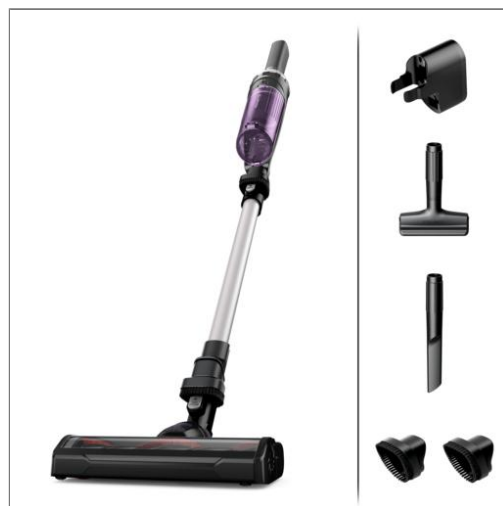
X-NANO ESSENTIAL RH1129WO RH1129WO