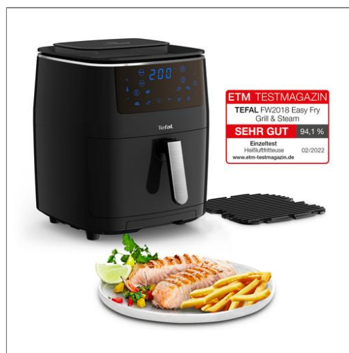
Easy Fry Grill & Steam FW2018 FW2018CH