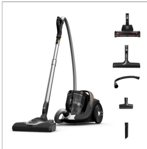
Green Force Cyclonic Effitech®+ Bagless Vacuum Cleaner R07C89EA