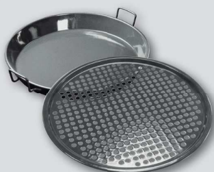
KIT GOURMET 480|570 2 PIÈCES