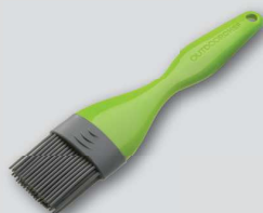
PENNELLO IN SILICONE