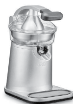
Leva di chiusura chiusa: La leva di pressione è abbassata sul cono di spremitura