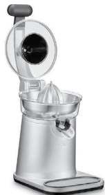
Leva di chiusura aperta: La leva di pressione è alzata