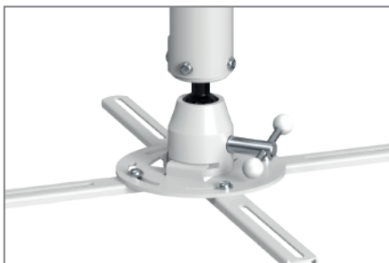
Multidimensional einstellbar dank Kugelgelenk