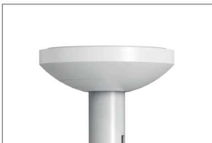
stabiler Deckenmontageteller mit Abdeckung

Die Oberfläche ist durch eine schlag- und kratzfeste Pulverbeschichtung in weiß veredelt.