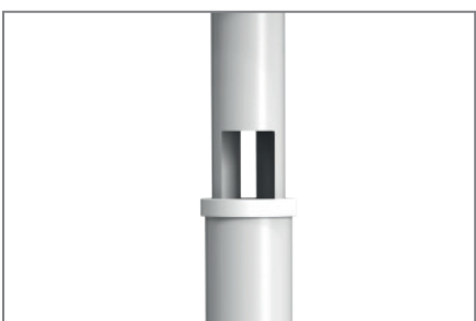
Kabelmanagement innerhalb des Teleskoprohres