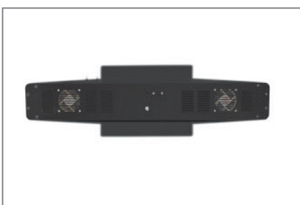
aktive Lüftung für perfekte Luftzirkulation