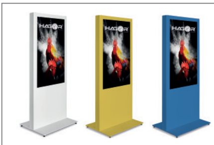
RAL-Ton nach Wunsch

Durch eine Reihe von Zusatzoptionen lässt sich die Stele für den gewünschten Einsatzort optimieren und individuell anpassen.