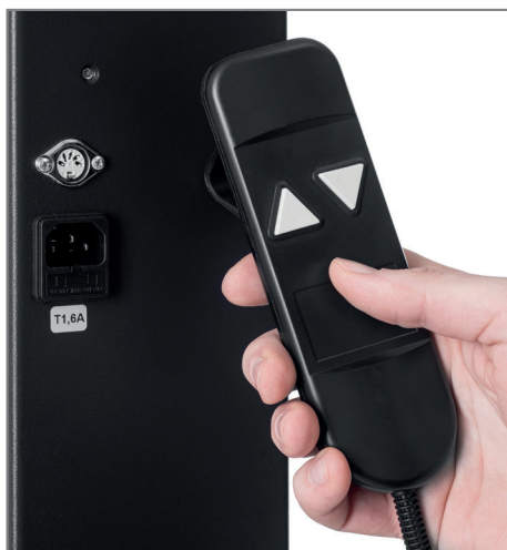
Tastbedienung für Höheneinstellung

WH Moto 80 | 160 Extensions 870 - 1150 mm Art.-Nr.: 8906