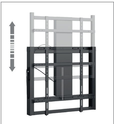
500 mm Fahrweg