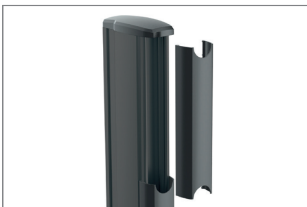
Kabelmanagement entlang der Säulen