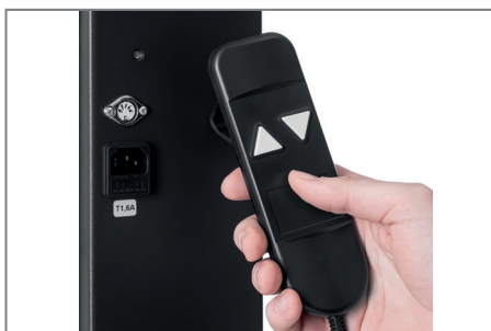
Tastbedienung für Höheneinstellung