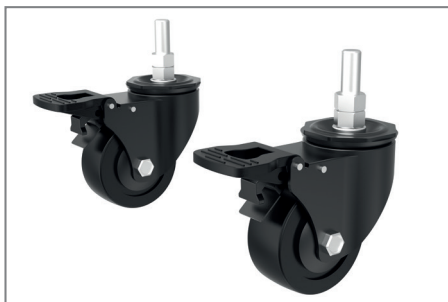
Lenkrollen mit Feststellbremse