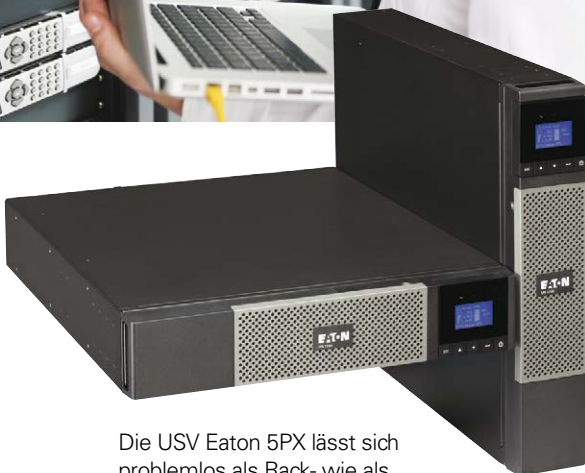
Die USV Eaton 5PX lässt sich problemlos als Rack- wie als Towermodell einsetzen.