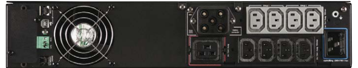
5PX von 1500VA bis 3000VA