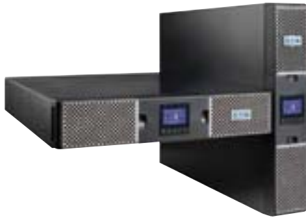
3000 W dans deux unités de Rack seulement (2U) !