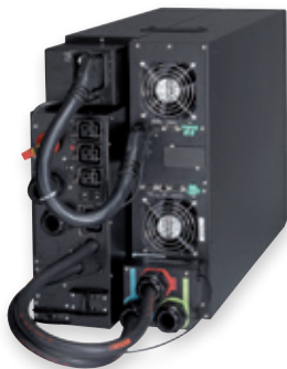
Eaton 9PX 11kVA mit Wartungsbypass

Die 9PX ist eine Energy Star® qualifizierte USV