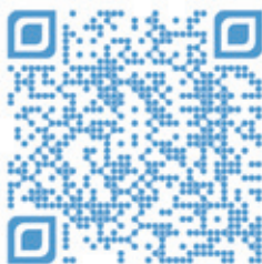
Video zur Eaton 9PX